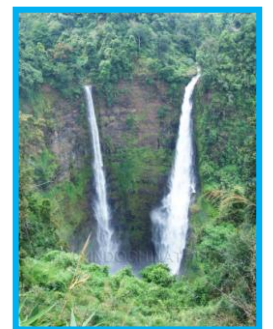
น้ำตกตาดฟาน

ชมได้อย่างใกล้ชิด คำว่า เอื้อง แปลว่า เสียดผา หลังจากนั้นเดินทางต่อไปเพื่อชมความงามของ น้ำตกตาดฟาน หรือน้ำตกคองหัวสาว เกิดจาก น้ำตกคนละสายไหลมาเจอกัน จึงเรียกอีกชื่อว่า น้ำตกคู่แฝด ตาดฟานเป็นสถานที่ถ่ายทำ จูราสิค พาร์ค ภาคแรก มีความสูงประมาณ 120 เมตร บริเวณรอบน้ำตกมีป่าไม้ สีเขียวอุดมสมบูรณ์ ระหว่างทางเดินเข้าไปชมน้ำตกด้านหน้า จะมีชาวบ้านนำสินค้าพื้นเมืองมาจำหน่าย ไม่ว่าจะเป็นกาแฟที่ตัวเอง