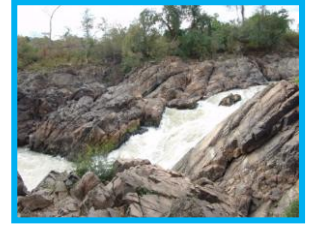
น้ำตกหลี่ผี

บริการนำดื่มสิ่งทำนละ 1 ขวด ผ้าเย็น และผ้าปิดจมูก แล้วนั่งเรือขนาดใหญ่ ล่องตามแม่น้ำโขง ชม มหานทีสีพันดอน (ดอน หมายถึง