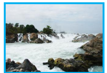
น้ำตกคอนพะเพ็ง