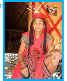
ชนเผ่าต่าง ๆ ในอุทยานบาเจียง